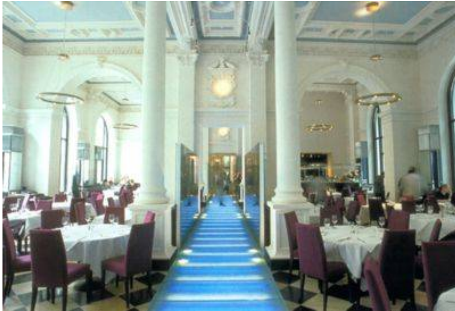
LENBACH . Restaurant