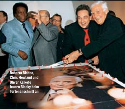
Roberto Blanco, Chris Howland und Oliver Kalkofe feiern Blacky beim Tortenschnitt an