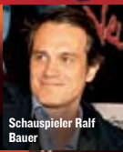
Schauspieler Ralf Bauer