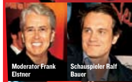
Moderator Frank Elstner